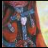
Vier Sicherheits- nadeln